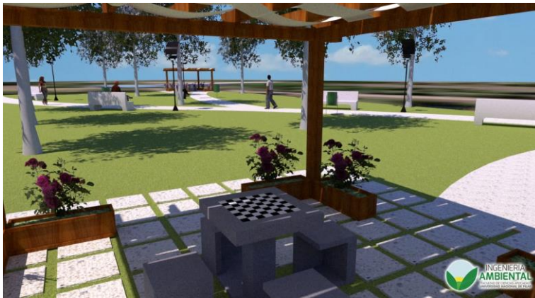
Gráfico 2. Ubicación de paneles solares