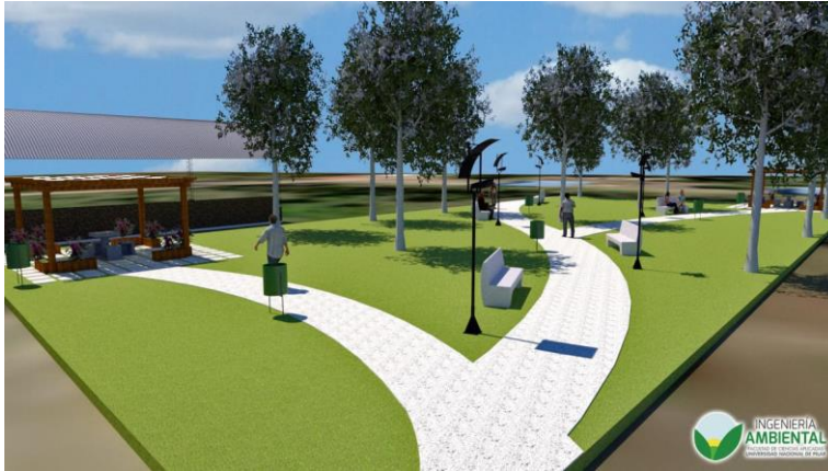
Gráfico 1. Diseño de los camineros