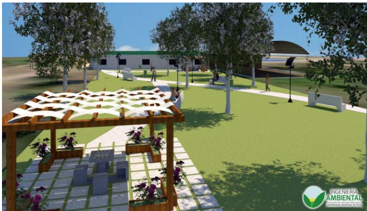
Gráfico 5. Paneles solares