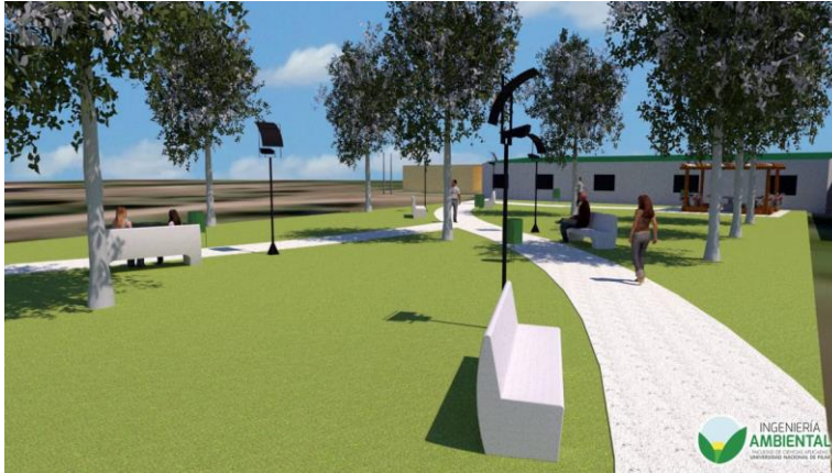
Grafico 4. Aspecto de camineros