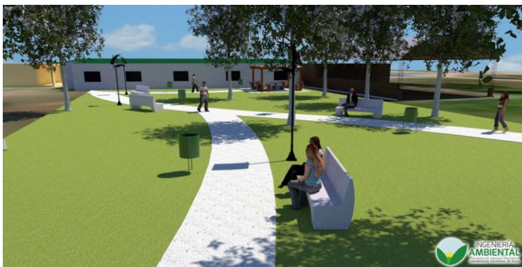
Gráfico 3. Bancos y camineros, aspecto general