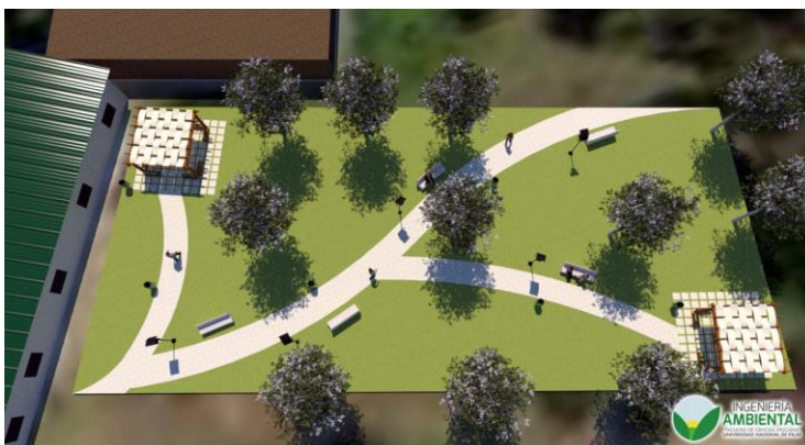
Grafico 6. Vista aérea de camineros y paneles solares